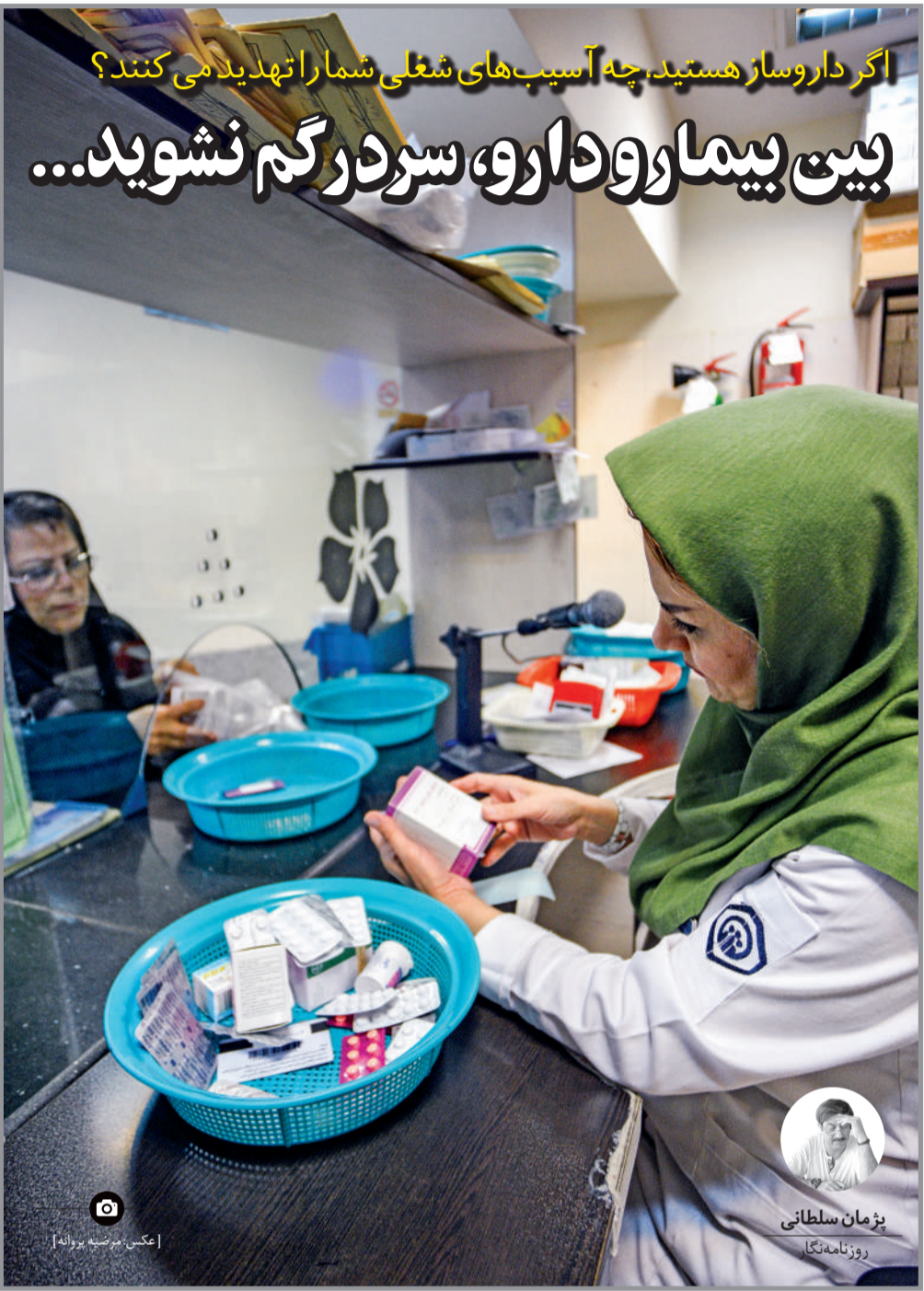
یژمان سلطانی روزنامه‌نگار